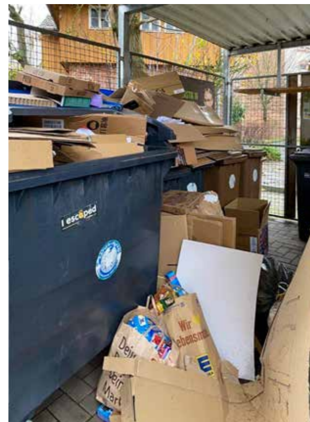
Kein schöner Anblick: So soll es nicht in den Mülleinhausungen aussehen.