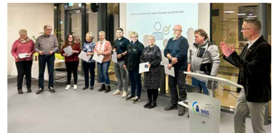
... erhalten für Ihr Ehrenamt eine Urkunde und die bronzene Ehrennadel.

Der Vorstand bedankte sich bei den Vertreterinnen und Vertretern für ihre Unterstützung und für die sehr gute Zusammenarbeit im vergangenen Jahr.