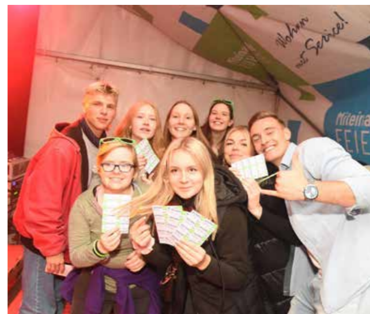
Die Gewinner unseres Instagram-Gewinnspiels.