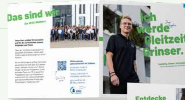
Unsere neuen Flyer und Postkarten für die Azubikampagne