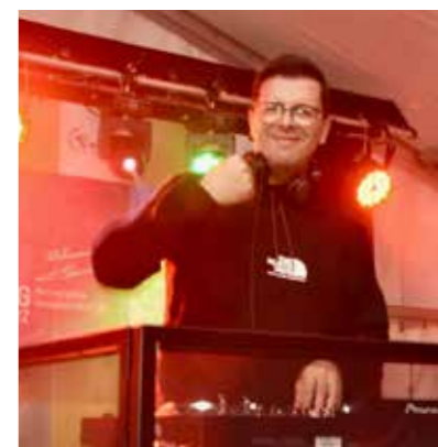
Die beiden DJs sorgten für ordentlich Stimmung.