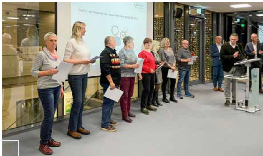
Unsere neugewählten Vertreterinnen und Vertreter ...

Der Krieg auf dem europäischen Kontinent war mit all seinen Auswirkungen, wie schon im vergangenen Jahr, wieder spürbar – Energiekosten, Baukosten und Verbraucherpreise stiegen weiter. Zum Jahresende werden die Planungen für das kommende Jahr fertiggestellt, hier werden die vorgesehenen Investitionen, aber auch die steigenden Aufwendungen für Be-