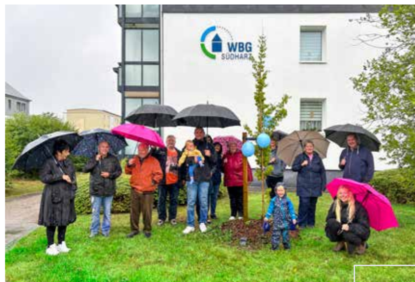
Familie Darms mit Nachbarn des Hauses.

Melden Sie sich ganz einfach mit diesem Formular bei uns, wenn Sie auch einen Sprössling für Ihren Nachwuchs möchten.