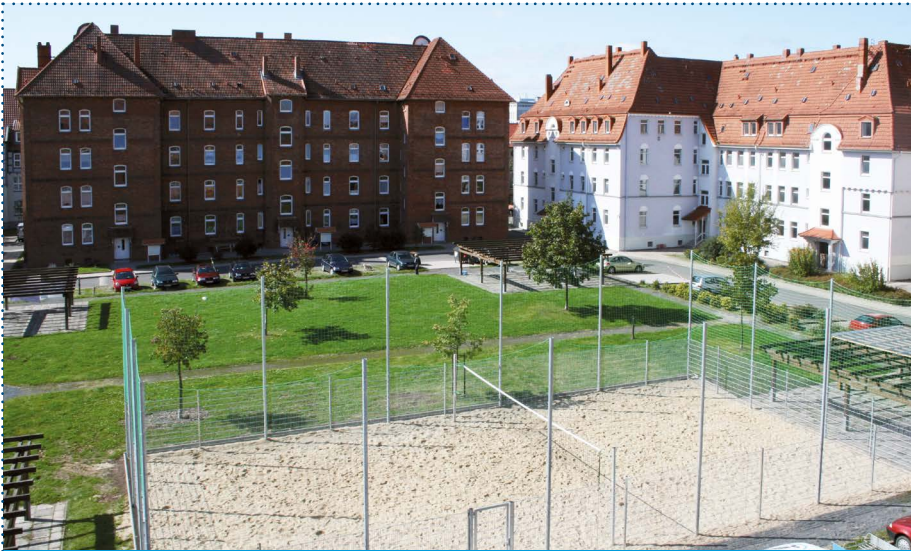
Lt. Umfrage wird im Bochumer Hof in Nordhausen eine bessere Beleuchtung gewünscht.