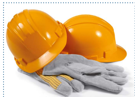
Verbesserung der Qualität und Termintreue von Handwerkern durch unsere WBG.

Hierzu haben wir einen neuen Organisationsablauf in unserer Abteilung Technik erarbeitet, der die Kontrolle der Termintreue und Qualität der Bauausführung durch die Handwerker verbessert.