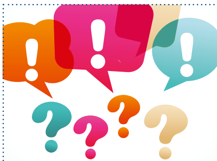
270 individuelle Hinweise, Ratschläge und Kritiken zu unserer Umfrage der WBG.

„Es wäre toll, wenn im Bochumer Hof in Ndh Lampen/Laternen angebracht werden könnten. Da es vor allem im Winter sehr dunkel ist, wenn man ankommt.“