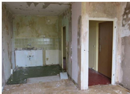
Wohnung vor Sanierung

turen in Mieteinheiten und Häusern rund 700,0 T€ eingeplant. Für den bedarfsorientierten Umbau von Bädern werden 100,0 T€ zur Verfügung gestellt. Auch in diesem Jahr wird ein anspruchsvolles Investitionsprogramm umgesetzt.