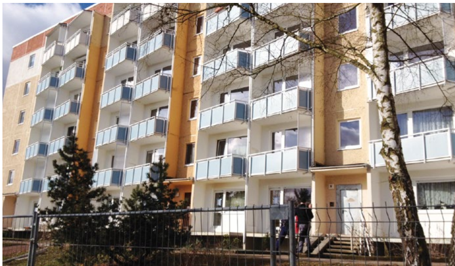
Ist-Zustand am Aueblick 5–8 in Nordhausen

Parallel wird in Bleicherode in der Löwentorstraße 2–2c ein ebenso großes Vorhaben beginnen und unter dem Motto „ Seniorenwohnen am Löwentor “ zukünftig geführt werden. Mit rund 3,6 Millionen € wird auch an diesem Standort in seniorenfreundliches Wohnen nachhaltig investiert. Die Schaffung von barrierefreien bzw. barrierearmen Hauszugängen, der Einbau von Personenaufzügen , die Einrichtung von flachen und bodengleichen Duschen sowie der Anbau von neuen und größeren Balkonen mit bodengleichem Austritt sind die markantesten Neuerungen.