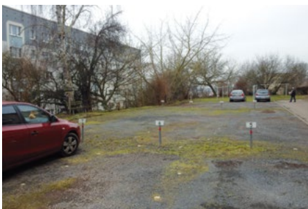
Ist-Zustand der PKW-Stellplätze in der Dr.-Silberborth-Straße 1–9 und 11–17

Darüber hinaus werden die PKW-Stellplätze in der Dr.-Silberborth-Straße 1–9 und 11–17 befestigt und gepflastert. Für diese Maßnahmen stehen rund 170,0 T€ zur Verfügung. Für ca. 200,0 T€ werden auch diverse Treppenhäuser malermäßig instand gesetzt.