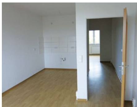
Wohnung nach Sanierung