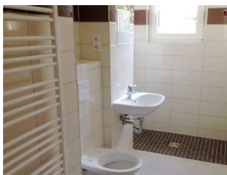
Wohnung nach Sanierung