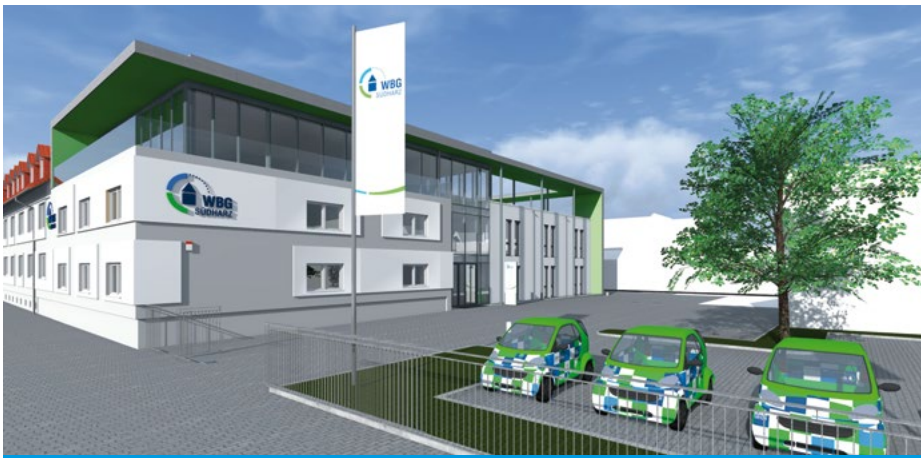
Zukünftige Außenansicht der Geschäftsstelle in der Bochumer Straße 3/5 in Nordhausen

Maßnahmen im Wohnumfeld, wie z. B. die grundhaften Sanierungen der Gehwege vor den Häusern Birkenweg 5–24 und Hardenbergstraße 24–46 in Nordhausen ergänzen das umfangreiche Bauprogramm.