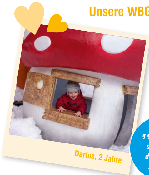
Darius, 2 Jahre