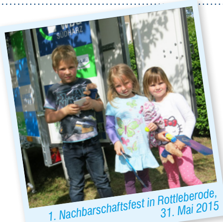
1. Nachbarschaftsfest in Rottleberode, 31. Mai 2015