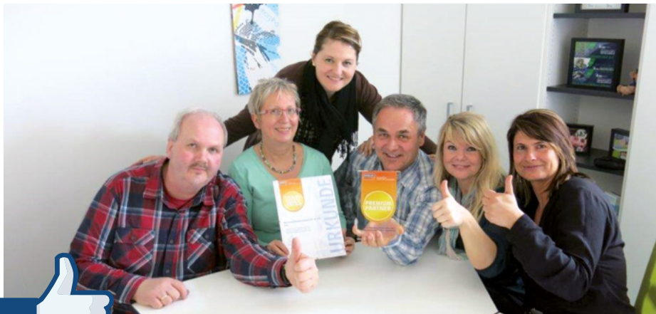
Unserem Vermieterteam gefällt die Auszeichnung von Immobilien Scout 24

Unsere langjährige Erfahrung, besonderes Engagement für Kunden und herausragende Kundenorientierung haben sich gelohnt!