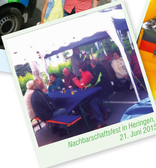
Nachbarschaftsfest in Heringen, 21. Juni 2015