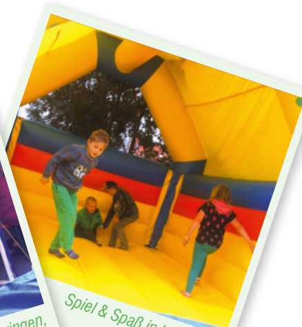
Spiel & Spaß in Heringen, 21. Juni 2015

Das Team von der Gaststätte Friedenseiche in Nordhausen versorgte unsere Gäste mit Essen und Trinken zu kleinen Preisen. Der Kreissportbund kümmerte sich wie immer liebevoll um unsere Kleinsten .