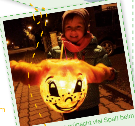
Das WBG-Team wünscht viel Spaß beim Nachbasteln!