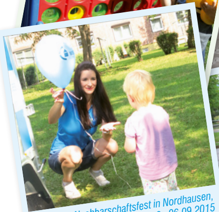
Nachbarschaftsfest in Nordhausen, Töpferstraße 06.09.2015