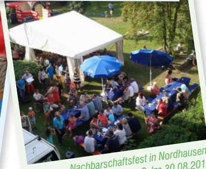
Nachbarschaftsfest in Nordhausen, Salza 30.08.2015