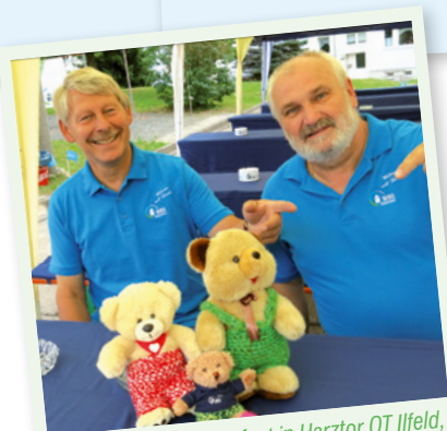
Nachbarschaftsfest in Harztor OT Ilfeld, Schröderstraße 12.07.2015