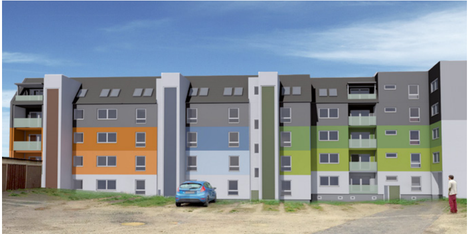
Entwurf zur zukünftigen Neugestaltung der Nordwestseite „Seniorenwohnen am Löwentor“