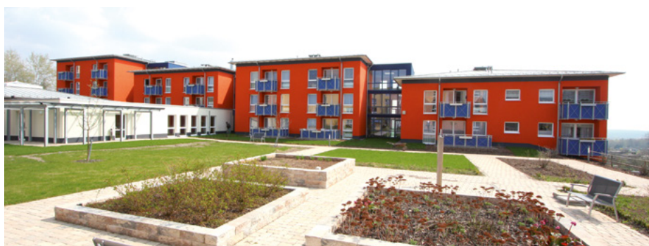
Rolf Prophet verbringt seinen Lebensabend in der Seniorenwohnanlage „An der Zichorienmühle“

Wir wünschen Herrn Prophet für die Zukunft alles Gute in unserer WBG Südharz.