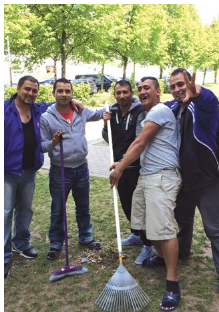
Helfer bei der Arbeit

Wie bereits im vergangenen Kurier mitgeteilt, haben wir uns der Herausforderung zur Unterbringung von Asylsuchenden gestellt. Dabei ist auch die Unterstützung der Sozialarbeiter von „Schrankenlos e. V.“ und die gute Zusammenarbeit mit dem Landratsamt ein wichtiger Faktor.