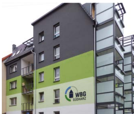
Löwentorstraße 2-2 c wurde mit Aufzügen ausgestattet

Über 3,0 Millionen Euro investiert die WBG Südharz hierfür und setzt damit ein weiteres Zeichen für die Zukunft und den Erhalt des Wohnstandortes Bleicherode.