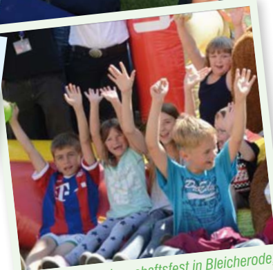
Nachbarschaftsfest in Bleicherode, 05.06.2016