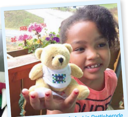
Nachbarschaftsfest in Rottleberode, 04.09.2016