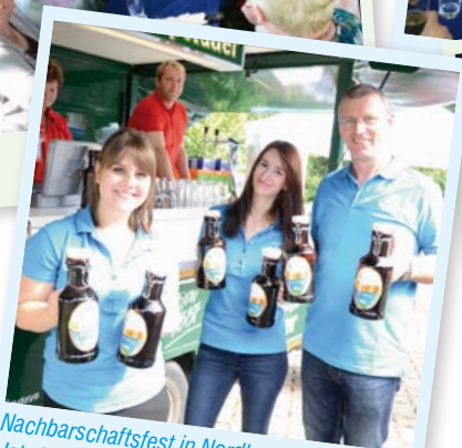
Nachbarschaftsfest in Nordhausen Jakob-Plaut-Straße, 03.07.2016