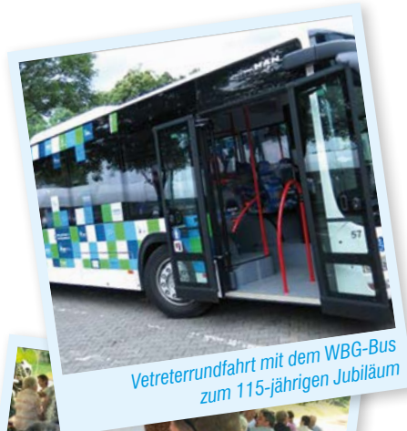
Vetreterrundfahrt mit dem WBG-Bus zum 115-jährigen Jubiläum

Als ein besonderes Highlight im Jubiläumsjahr wurde bereits im letzten WBG-Kurier auf die Dreharbeiten zum neuen Image-Film unserer WBG Südharz aufmerksam gemacht.