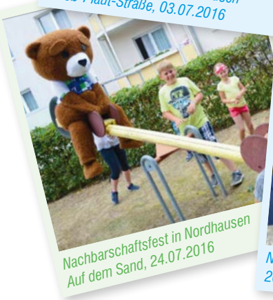
Nachbarschaftsfest in Nordhausen Auf dem Sand, 24.07.2016