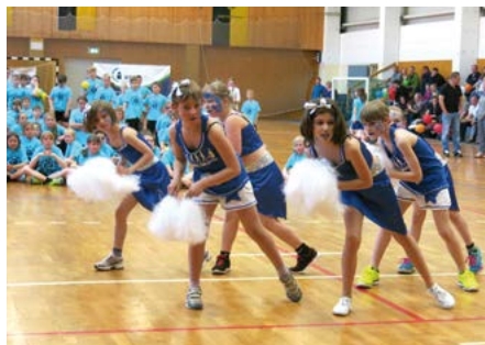
WBG „Ran an den Ball“

Gerade die Zusammenarbeit und Unterstützung des Vereinslebens ist uns wichtig, um vor Ort zu einer zukunfts-fähigen Entwicklung unserer Region beizutragen.