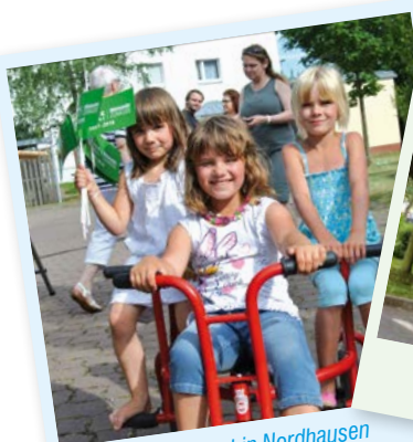
Nachbarschaftsfest in Nordhausen Conrad-Fromann-Straße 17.07.2016