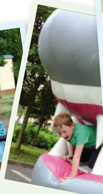
Nachbarschaftsfest in Heringen, 29.05.2016