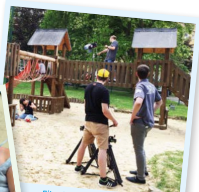
Filmdreh zum Nachbarschaftsfest in Bleicherode, 05.06.2016