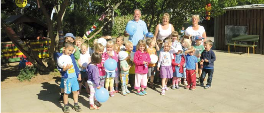
Sponsoring von Fußballbällen für die Kita „Am Frauenberg“ in Nordhausen

In den vergangenen Jahrzehnten hat sich unsere WBG Südharz zum größten Wohnungsvermieter in Nordthüringen entwickelt. Wir sehen uns nicht nur als Wohnungsanbieter, sondern auch als starker Partner , wenn es um die Förderung von örtlichen Institutionen und Vereinen geht.