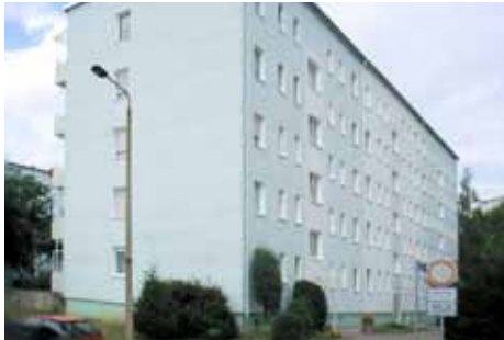
NDH Neustadtstr. 19–23