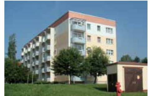
NDH Stolberger Str. 91–105, 107–113