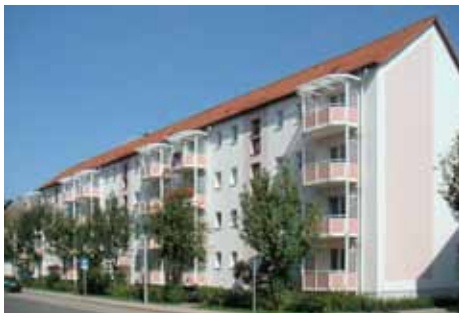
NDH Th.-Müntzer-Str. 2–6, 8–12