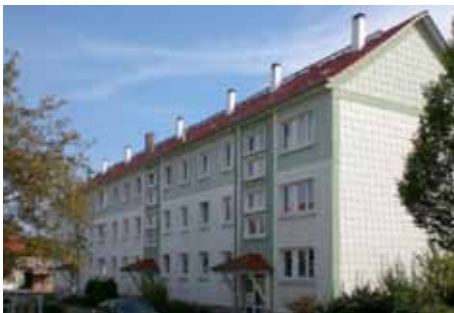
BLR Gartenstr. 61–63