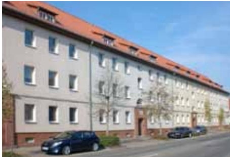
NDH Bochumer Str. 56–64