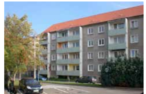
BLR Freiheitsstraße 9a–c