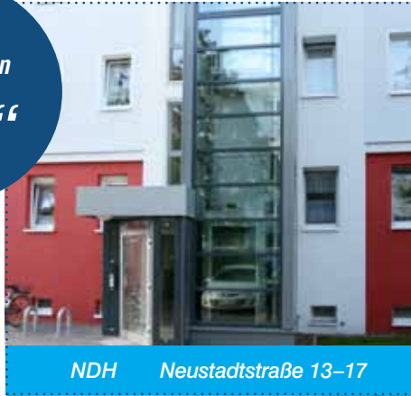
NDH Neustadtstraße 13–17

Umfassende Sanierungen an den Objekten mit einem Gesamtvolumen in Höhe von ca. 1,5 Mio. € trugen dazu bei, unsere Objekte für unsere Mitglieder noch attraktiver und bedarfsgerechter zu gestalten. Der Anbau von Fahrstühlen in der Neustadtstraße 13–17 in Nordhausen oder die Erneuerung der Fassade inklusive der Balkonanlagen in der Gartenstraße 58–60 in Bleicherode sind nur zwei Beispiele dafür. Hinzu kommen Aufwendungen in Höhe von ca. 2,9 Mio. € für die laufenden Instandhaltungsmaßnahmen in und um unsere Wohnhäuser.