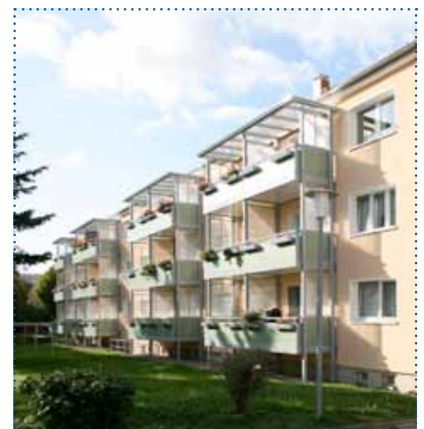
BLR Gartenstraße 58–60